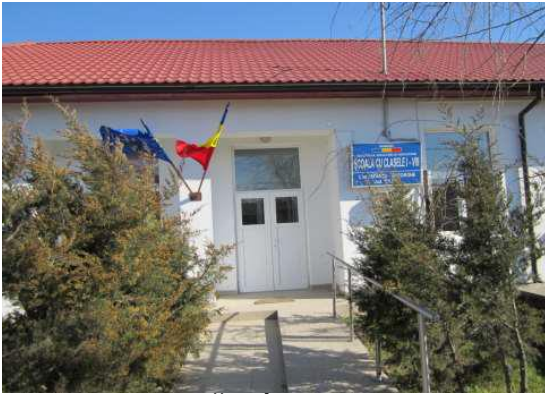
Școala Gimnazială Sfântu Gheorghe